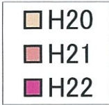
全科 新規入院患者数比較 H20年度・H21年度・H22年度