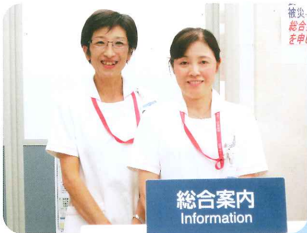
看護副部長 外来主任師長