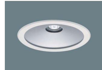
高天井ダウンライト XND9931SS-LR9 (100-242V) 昼白色 (5000K) Ra70

○希望小売価格 192,800円 (税抜) ※掲載の価格には消費税は含まれていません。 (14380 lm) (106.7W) (134.7 lm/W) ● (本体・NDN97945S_LR9+枠・NNK00600W) LED内蔵・電源ユニット内蔵 埋込穴φ400・埋込高372・重7.2kg 仕様：枠：銅板(ホワイトつや消し仕上) 反射板(上部)：アルミ(銀色鏡面仕上) 反射板(下部)：アルミ(銀色鏡面仕上) 光源寿命60000時間(光束維持率80%) 落下防止ワイヤー付 備考：適合オプション(別売)：傾斜天井用枠15度NK09915Z・傾斜天井用枠20度NK09920Z 適合調光器(別売)：ライトマネージャー-Fx NQ28861K+NQ110161・NQ28841K+NQ110161 信号線式ライコンNQ21526・NQ21516・NQ21506・NQ21505・NQ21502 ライトコントロール・信号線式(LED・インバータ蛍光灯用)NQ21535U・NQ21532U 拡散タイプ 調光範囲(約5%~100%) ●天井面取付専用 セパレートセルコン(A, AN, NTタイプ)との組み合わせ可能 高天井ダウンライトXNDN9916SS相当品 注)調光する場合は適合調光器(別売)と組み合わせてご使用ください。 注)直下近接限度50cm 注)断熱施工仕様ではありません。 注)器具の取付周囲温度は-10~40℃でご使用ください。 一時的に50℃まで上昇する場所でも使用は可能ですが、部品劣化による短寿命や光束低下の原因となります。 継続使用はご遠慮ください。 注)高天井ダウンライトを傾斜天井に取り付ける場合は、必ず適合傾斜天井枠(別売)と組み合わせてご使用ください。 注)LEDにはバツキがあるため、同一品番商品でも商品ごとに発光色、明るさが異なる場合があります。