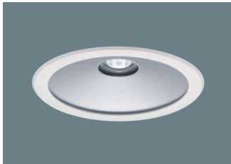
高天井ダウンライト XND9930SS-LR9 (100-242V) 昼白色 (5000K) Ra70

○希望小売価格 192,800円 (税抜) ※掲載の価格には消費税は含まれていません。 (14325 lm) (106.7W) (134.2 lm/W) ● (本体・NDN97940S_LR9+枠・NNK00600W) LED内蔵・電源ユニット内蔵 埋込穴φ400・埋込高372・重7.2kg 仕様：枠：銅板(ホワイトつや消し仕上) 反射板(上部)：アルミ(銀色鏡面仕上) 反射板(下部)：アルミ(銀色鏡面仕上) 光源寿命60000時間(光束維持率80%) 落下防止ワイヤー付 備考：適合オプション(別売)：傾斜天井用枠15度NK09915Z・傾斜天井用枠20度NK09920Z 適合調光器(別売)：ライトマネージャー-Fx NQ28861K+NQ110161・NQ28841K+NQ110161 信号線式ライコンNQ21526・NQ21516・NQ21506・NQ21505・NQ21502 ライトコントロール・信号線式(LED・インバータ蛍光灯用)NQ21535U・NQ21532U 拡散タイプ 調光範囲(約5%~100%) ●天井面取付専用 セパレートセルコン(A, AN, NTタイプ)との組み合わせ可能 高天井ダウンライトXNDN9915SS相当品 注)調光する場合は適合調光器(別売)と組み合わせてご使用ください。 注)直下近接限度50cm 注)断熱施工仕様ではありません。 注)器具の取付周囲温度は-10~40℃でご使用ください。 一時的に50℃まで上昇する場所でも使用は可能ですが、部品劣化による短寿命や光束低下の原因となります。 継続使用はご遠慮ください。 注)高天井ダウンライトを傾斜天井に取り付ける場合は、必ず適合傾斜天井枠(別売)と組み合わせてご使用ください。 注)LEDにはバツキがあるため、同一品番商品でも商品ごとに発光色、明るさが異なる場合があります。