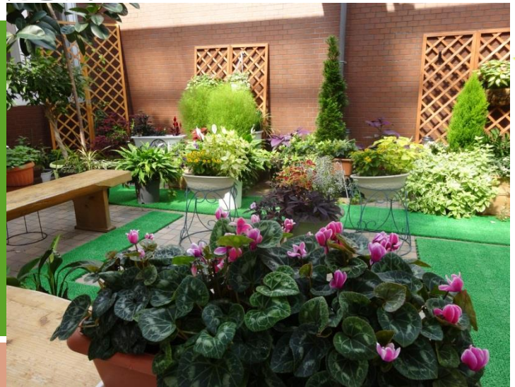
会計ホール横の中庭