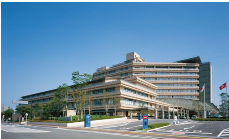
2005(平成17)年3月6日 新病院完成 同年3月22日全院開院(病床数691床)