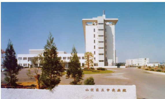
1970(昭和45)年9月 新病院完成 同年10月26日より富士見一丁目へ移転開院(病床数400床)