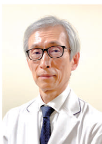
山梨県立中央病院 院長