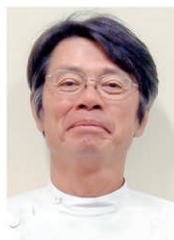
ゲノム解析センター センター長