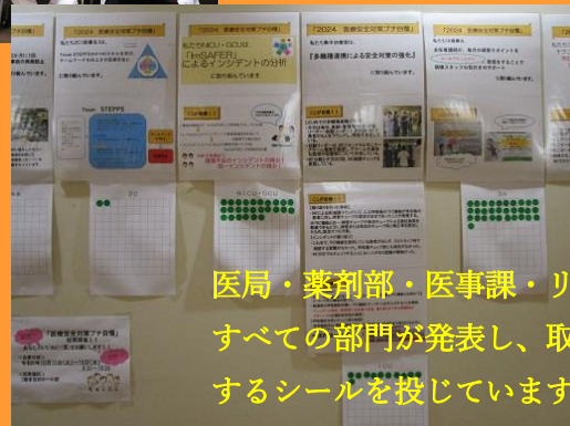
医局・薬剤部・医事課・リハビリなどすべての部門が発表し、取り組みを評価するシールを投じています