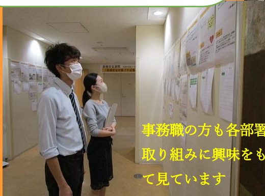
事務職の方も各部署の取り組みに興味をもって見えています